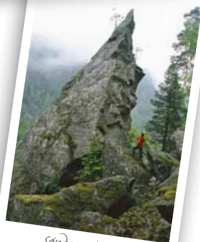
Søndag Kl 14.00 Guidet tur til Hærfangkirka

Vi tar forbehold om endringer i programmet eller trykkekfeil.