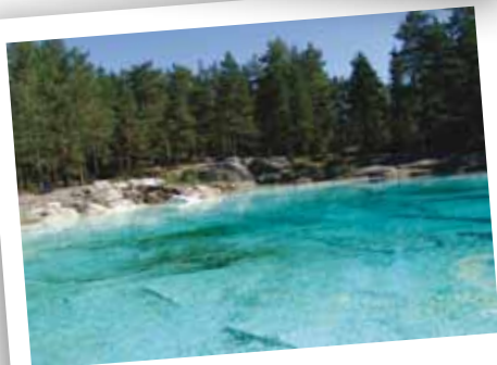
Lørdag Kl 09.00 Frokostbad på "Bader'n"

Program for Torsdag 23. juni - Fredag 24. juni - Lørdag 25. juni - Søndag 26. juni