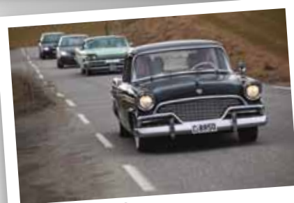
Lørdag Kl 12.00 Veterankjøretøytreff