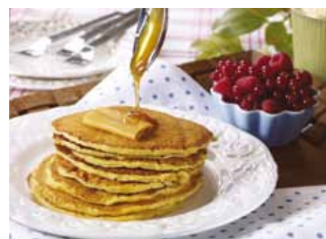
Lørdag Kl 12.00 Kafé med Bygdekvinnelaget