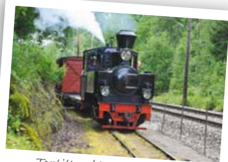
Tertitten kjører alle dagene

I løpet av dagen blir det nedrigging av tribuner og opprydding etter Skansespillet