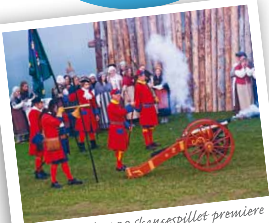
Torsdag Kl 21.30 skansespillet premiere